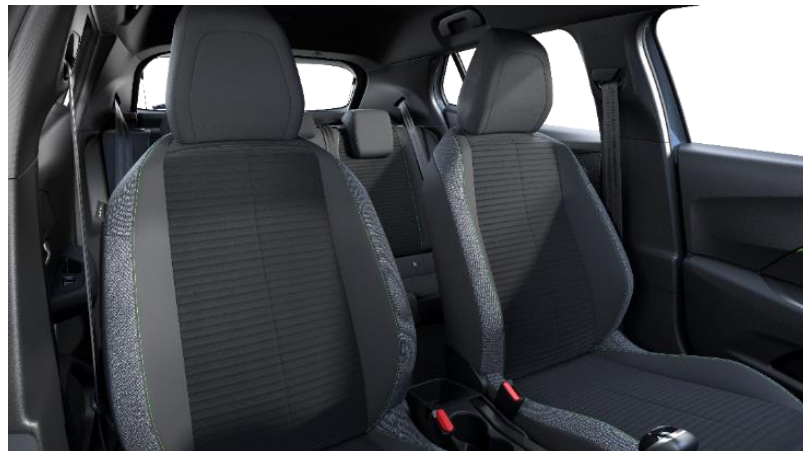
Stoff « PNEUMA 3D»