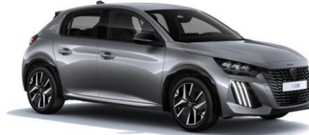
Artense Grau M0F4 - Option