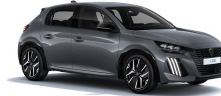
Selenium Grau M0LD - Option