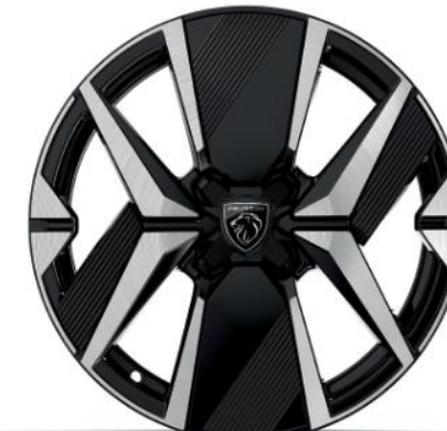
17" Zweifarbige Leichtmetallfelge