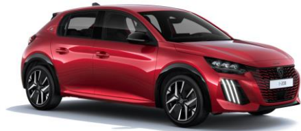
Elixir Rot M5VH - Option