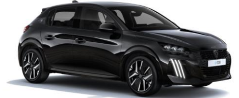
Perla Nera Schwarz M09V - Option