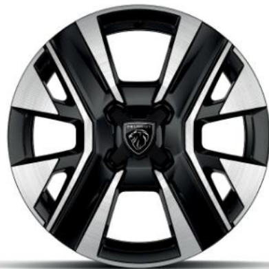
16" Zweifarbige Leichtmetallfelge