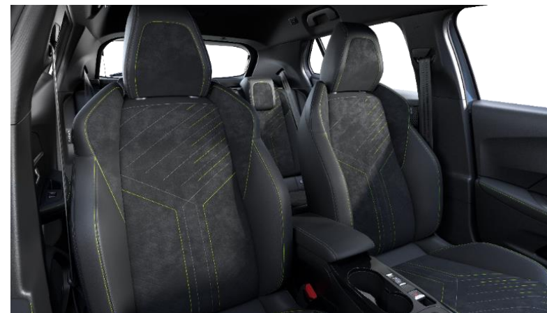
Alcantara® / Kunstleder