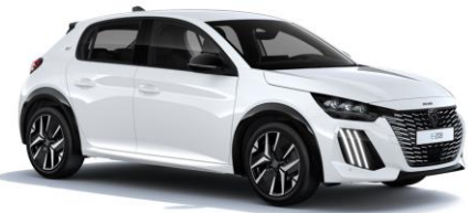
Schnee Weiß P0WP - Option