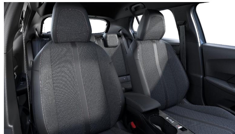
Stoff / Kunstleder « LOMSA »