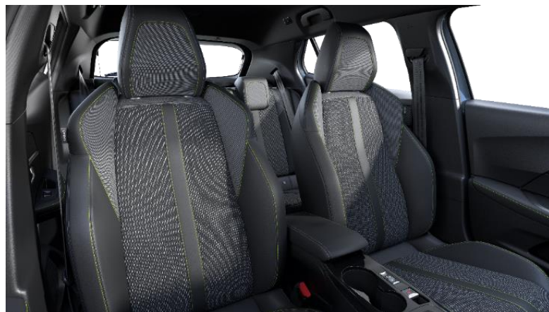
Stoff / Kunstleder „BELOMKA“