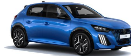
Vertigo Blau M6SM - Option